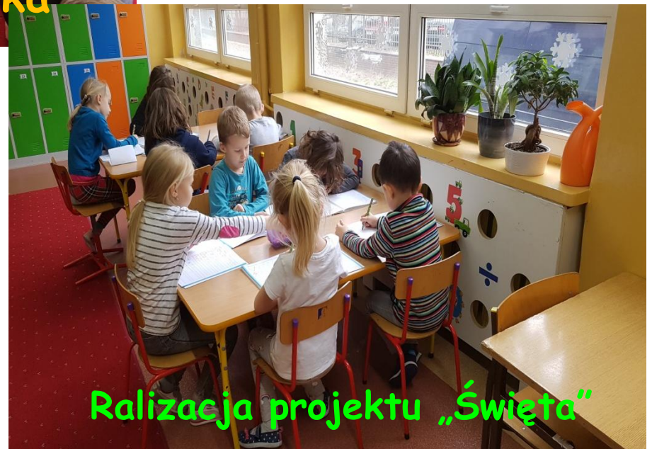
Ralizacja projektu „Święta”