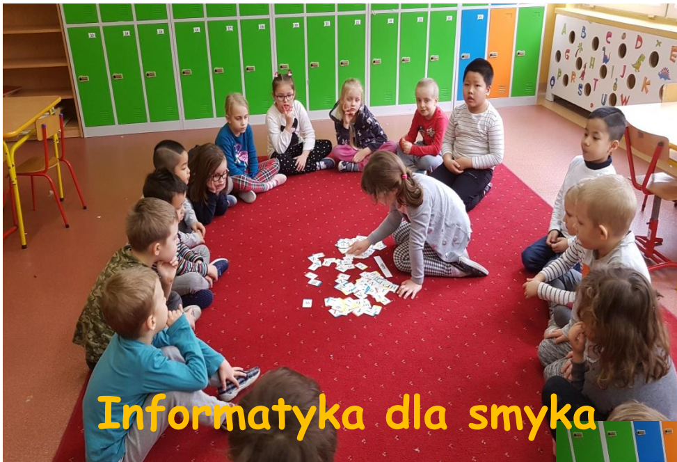
Informatyka dla smyka