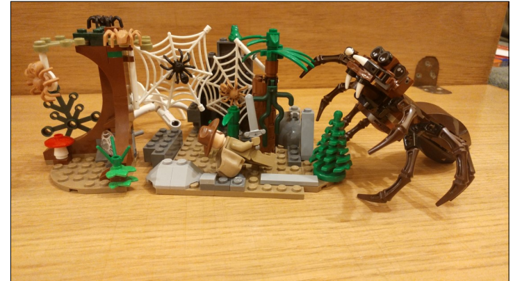
„Hobbit” – Tytus P. (6a)

Klocki Lego można wykorzystać w edukacji. Uczniowie naszej szkoły w czasie lekcji języka polskiego stworzyli w oparciu o treść lektur szkolnych projekty z klocków lego. Efekty ich pracy prezentujemy poniżej.